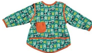
Couvre-tout manches longues