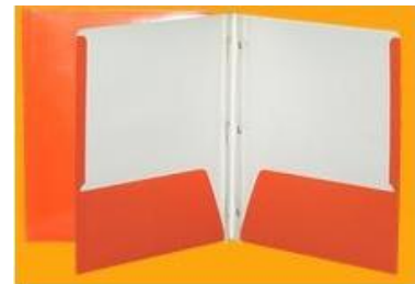
Couverture de présentation 3 trous avec pochettes